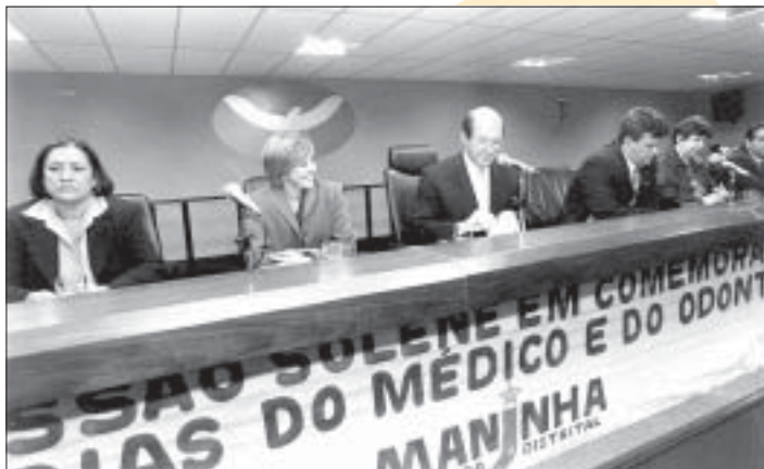
Os cirurgiões-dentistas foram homenageados na Câmara Legislativa