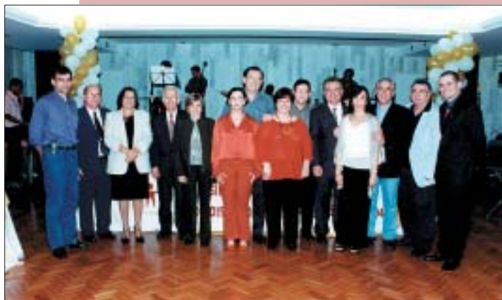
A nova diretoria empossada e alguns dos convidados