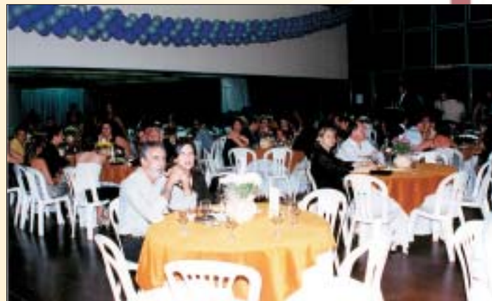
... foi novamente um grande sucesso