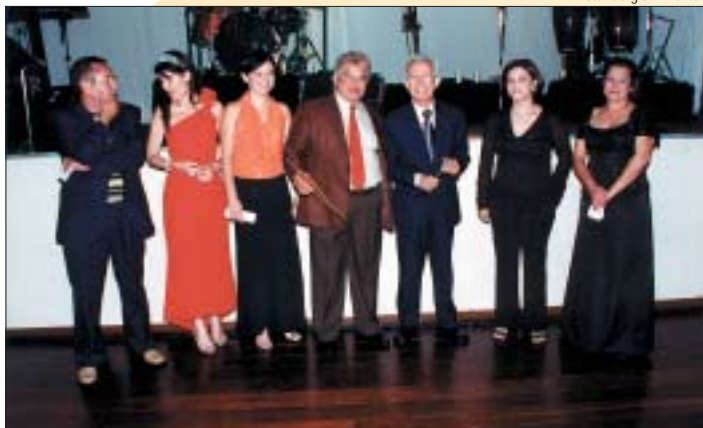
... Sindicato, CRO-DF e ABO Taguatinga...