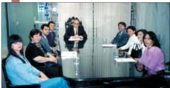
Dirigentes do SODF e da FIO foram recebidos pelo senador Ramez Tebet

Ao lado da Federação Interestadual dos Odontologistas, o SODF está buscando, no Senado Federal, apoio à aprovação da Proposta de Emenda Constitucional nº 30 (PEC 30), que permitirá o duplo vínculo para o cirurgião-dentista no serviço público. As entidades já conversaram com o presidente do Senado, Ramez Tebet, e com vários outros senadores.